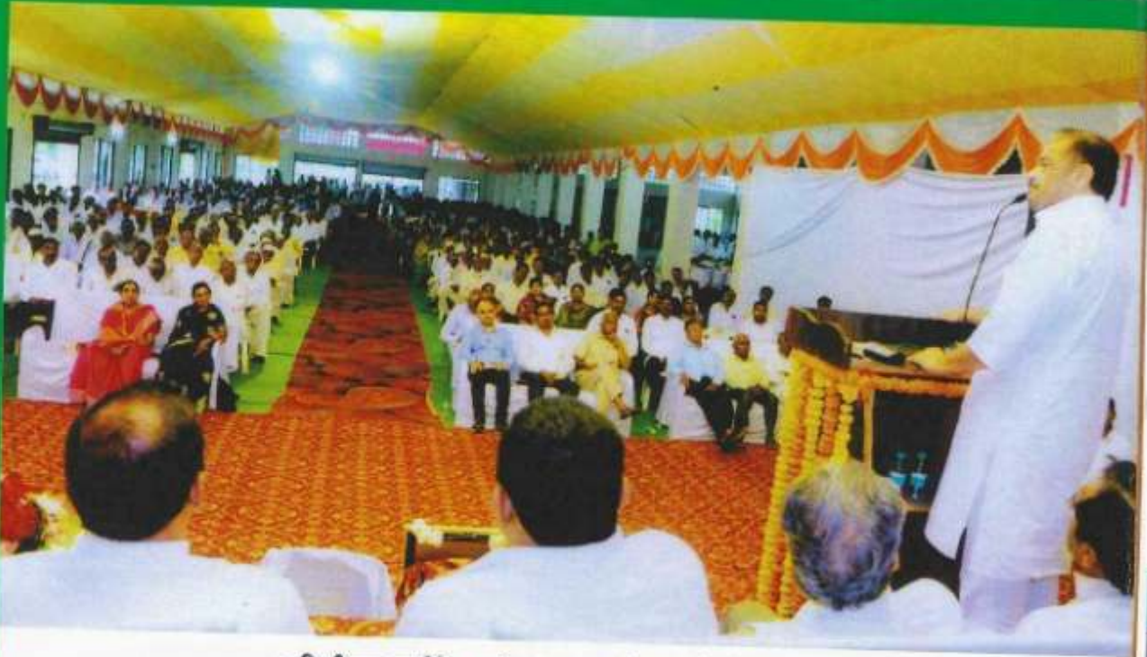
समितीच्या वार्षिक सर्वसाधारण सभेला संबोधित करतांना मा. श्री. सुनीलजी केदार माजी मंत्री महाराष्ट्र राज्य व आमदार सावनेर-कळमेश्वर क्षेत्र व उपस्थित मान्यवर