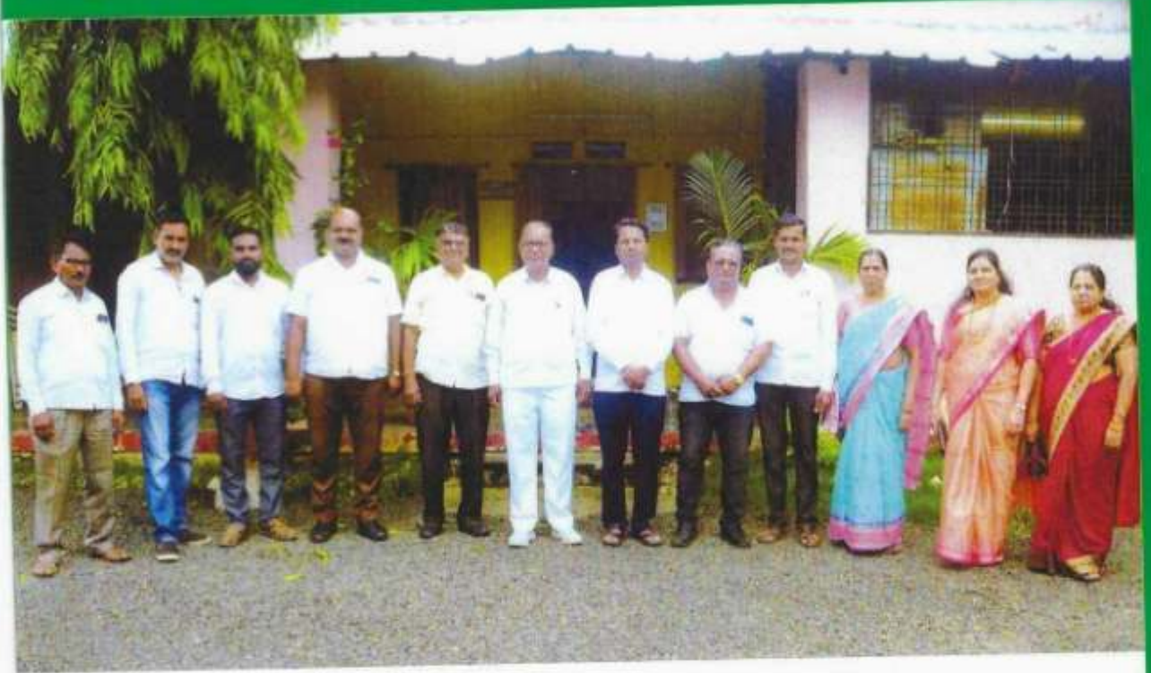
कृषि उत्पन्न बाजार समिती, कार्यकारी संचालक मंडळ, कळमेश्वर